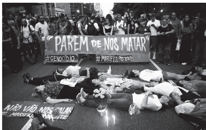
Acima alguns momentos da manifestação na Avenida Paulista; ao lado a ilustração de Latuff

de ordem entoadas pelos manifestantes: "Não acabou, tem que acabar, eu quero o fim da polícia militar".