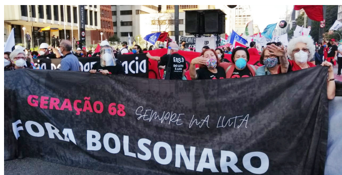
Professoras da PUC-SP presentes à manifestação

Na quinta-feira, 29/7, começou o Encontro Nacional dos Trabalhadores e Trabalhadoras do Setor Público, realizado de forma virtual. O Encontro tem como objetivo organizar a luta contra a