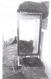
NÃO SOLHEMOS QUE LEGENDA, ESCREVER!!