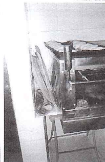
SEU SALGADINHO JUNTO COM OUTRAS TRALHAS