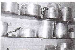
COMIDA SEM PROTEÇÃO AO MEIO DOS UTENSÍLIOS