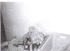
SE NÃO FOSSE PARA SERVIR TAVIA LA PORIA, NÃO LIGAVAM

Na foto acima, uma visão geral do movimento no restaurante; à esquerda, um dos painéis montados pela Comissão de Alimentação, com fotos ilustrando as condições de higiene do Restaurante Universitário.