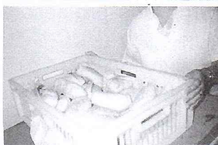
MAIS PÃES NÃO FEZ, AS CAIXAS (LATERAIS DAS OBTAS) FICANDO SUJAS