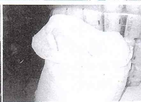
SACO DE FROSTAEPTO™ NÃO SE DEIXOU USADO NO CHÃO À PROVA DE BICHOS