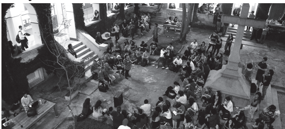
A assembleia no Pátio da Cruz

A implantação do ponto biométrico, tal como determinada pela Fundasp, privilegia o controle burocrático-administrativo da presença do professor em sala de aula, desprezando o conjunto das atividades acadêmico-pedagógicas que conferem a identidade da PUC-SP como espaço democrático de interlocução, produção de conhecimento e resistência ao autoritaris-