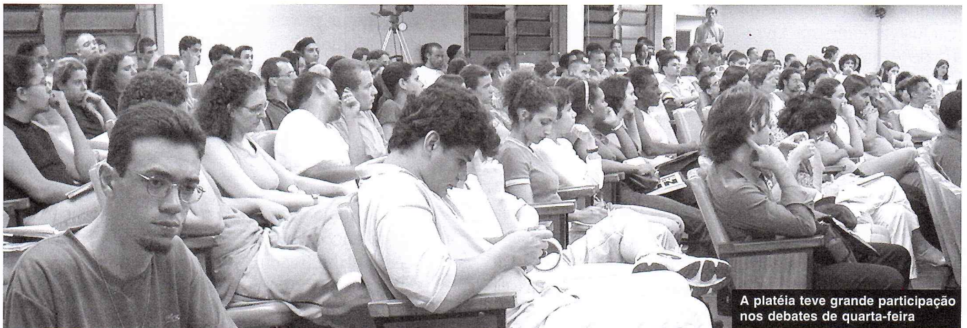
A platéia teve grande participação nos debates de quarta-feira